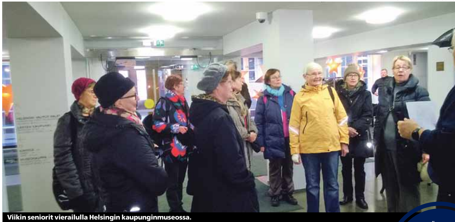
Viikin seniorit vierailulla Helsingin kaupunginmuseossa.