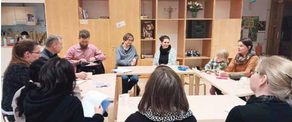
■ Tietoja hankkeen etenemisestä päivitetään Viikin kielipainotteisen opetuksen nettisivuille https://www.facebook.com/viikinkielipainotteinenopetus/ .

■ Viikkiläiset vanhemmat puuhaavat alueen päiväkoteihin ja kouluihin varhennettua kieltenopetusta. Osana tätä hanketta vapaaehtoiset vanhemmat pitävät Viikissä Kielikahvilaa pääasiassa alle kouluikäisille lapsille ja heidän perheilleen.